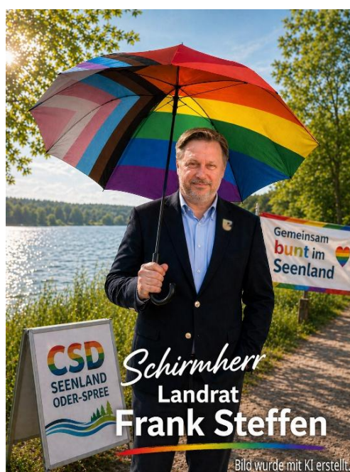
Bild wurde mit KI erstellt.